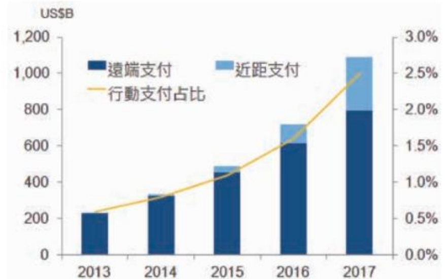
圖 1 全球行動支付市場規模 (2013~2017)

近距支付未來三年將以 205.5% 的年複合成 長率快速成長到 2017 年的 2,966 億元美金 ，對整體行動支付市場的占比也將大幅增長 到 27.2% 。